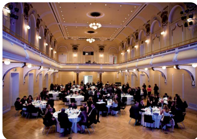
Podelitve najboljšim v najlepših dvoranah

poslušali, poiščete na spletni strani www.rtvsllo.si/val202 in spoznate, kako deluje podcast; tako se bo vaš radio kar najbolje prilegal vašemu urniku.