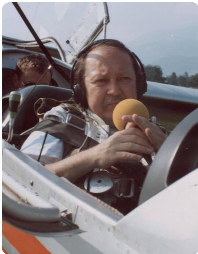
Radijski prenos iz jadralnega letala v Lescah leta 1994.