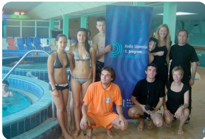
Najboljši v toboganskem spustu z radijsko ekipo